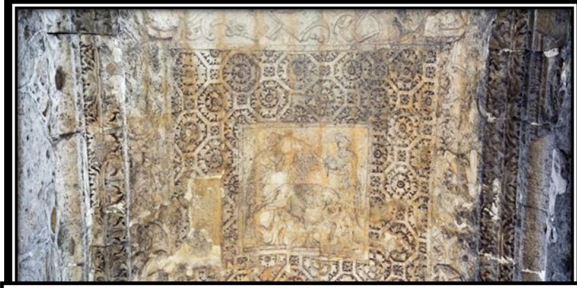
صورة رقم (4)