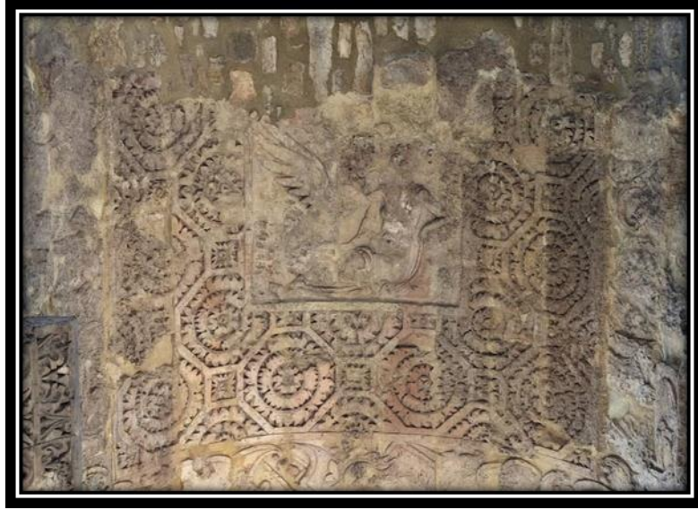
صورة رقم (5)