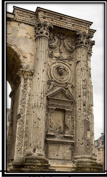
صورة رقم (3) نقلا عن

المحصول الذى تم حصاده، فلاح يمك فى يده المنجل الإيطالى، أحد الفلاحين وهو يقلب التربة وأحد الفلاحين يمك فأس، صور مناظر نباتية. صورة رقم (3) تمثال نصفى لرجل داخل درع