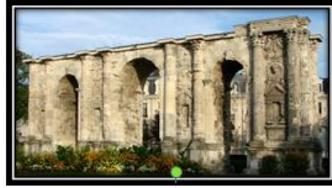
صورة رقم (1)