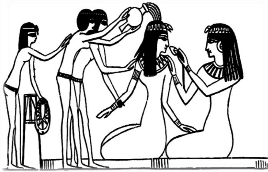
شكل (1) لسيدة وهي تتطهر وتغتسل من قبل أربع سيدات، نقلاً عن Abdel-Mohsen El-Khashab, Ptolemaic and Roman Baths of Kom el Ahmar, suppléments aux Annales du Service des Antiquités de l'Egypte ..89,p.1949(Cairo),